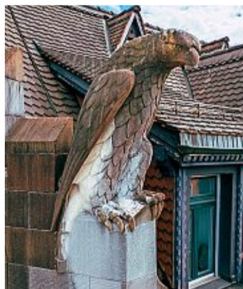
Die Adler-Statue hoch über der Kreuzung Sihlfeld-/Badener-/Bertastrasse.

Der Häuserkomplex inszenierte sich als «Gesamtkunstwerk mit dem Anspruch, Architektur und baukünstlerischen Schmuck zu vereinen», schreibt die Denkmalpflege weiter.