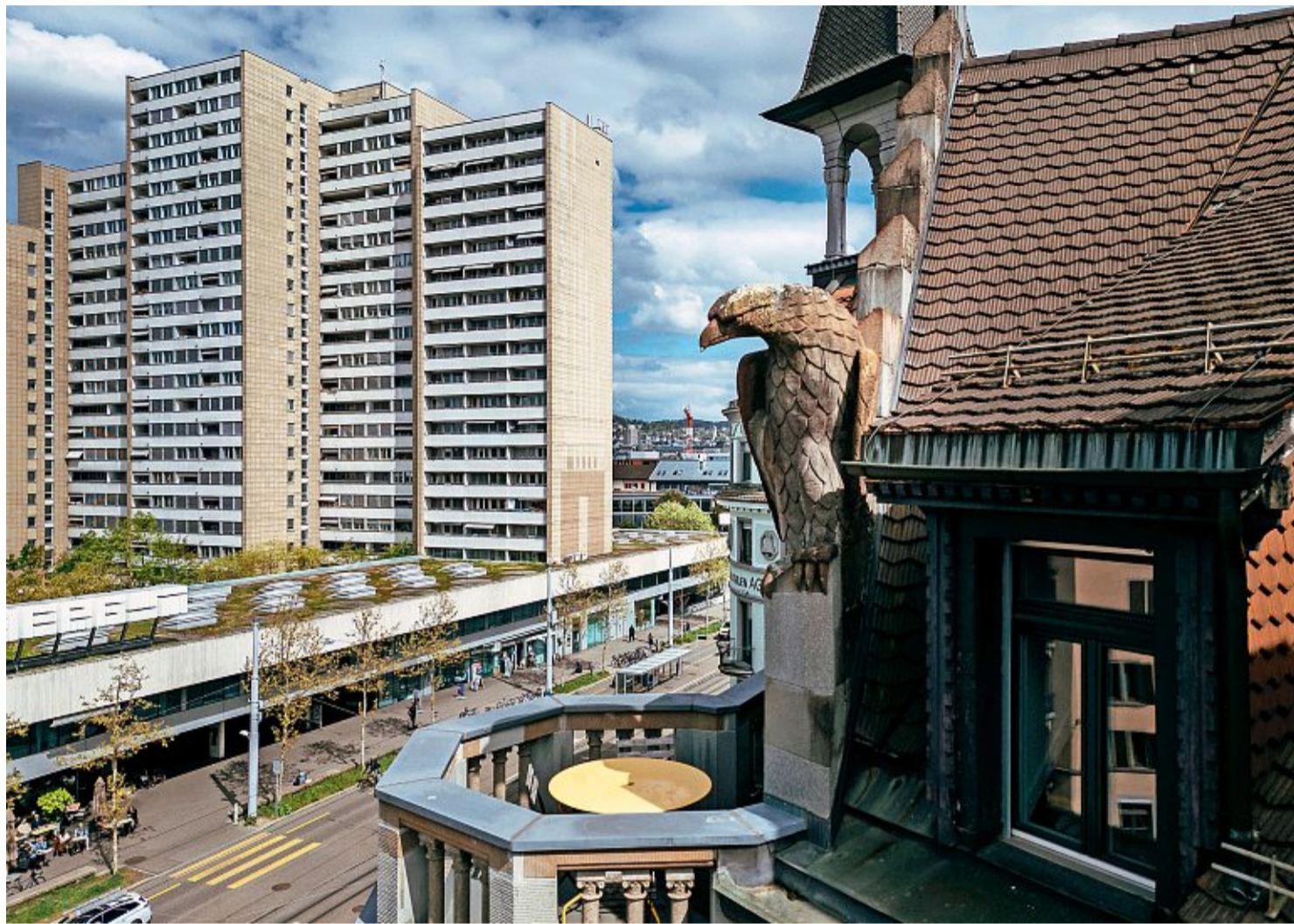
Alles im Blick – auch die städtische Wohnsiedlung Lochergut: Adler an der Bertastrasse 1 an der Grenze von Aussersihl und Wiedikon.

Das Gebäude steht seit 1990 unter Denkmalschutz. Dieser umfasst auch die Fassade und den Raubvogel auf dem Dach, wie Anatole Fleck, Sprecher des Amts für Städtebau, auf Anfrage sagt. Mit der Wohn- und Geschäftshausüberbauung Bertastrasse/Sihlfeldstrasse wollte Architekt Hardmeier seine Vielseitigkeit und sein architektonisches Können unter Beweis stellen, wie es im Bericht der Denkmalpflege heisst. «Dazu schuf er anhand der Überbauung ein monumentales Musterbuch, das die verschiedenen Baustile öffentlich zur Schau stellen sollte. Zum Einsatz kam ein Stilpluralismus von ägyptisch, römisch, romanisch und gotisch bis hin zum Barock und Jugendstil.»